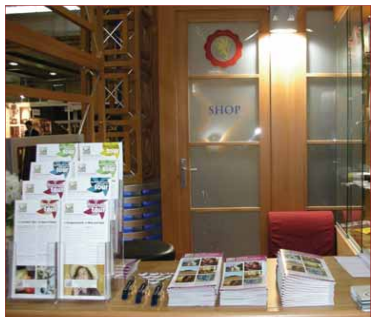
Concorso "Belle vetrine", Calici di Stelle e Vinitaly 2010.