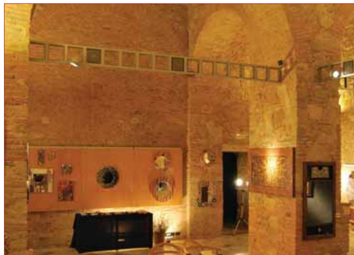
Centro espositivo “Le logge della Mercanzia” - Via Ricci.