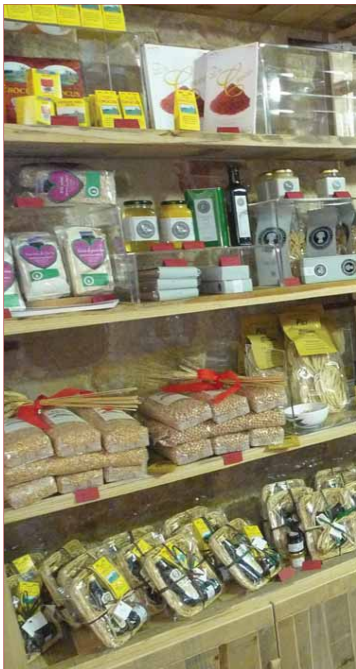
Progetto “Arte e cibo a Montepulciano” - Piazza Grande, 7.

Per informazioni sugli orari e sugli espositori è già attivo il sito www.madeinmontepulciano.it